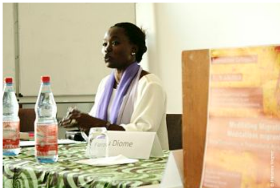
Fatou Diome delivers her keynote address „The Experience of Writing“