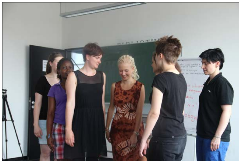
Rehearsal of the play Wait a Minute!

The seminar under which the above workshop was organized won the „Fakultätspreis für gute Lehrer 2013“. The award consisted of a cash prize of 500€ and a certificate. The cash prize was used to run the five days workshop.