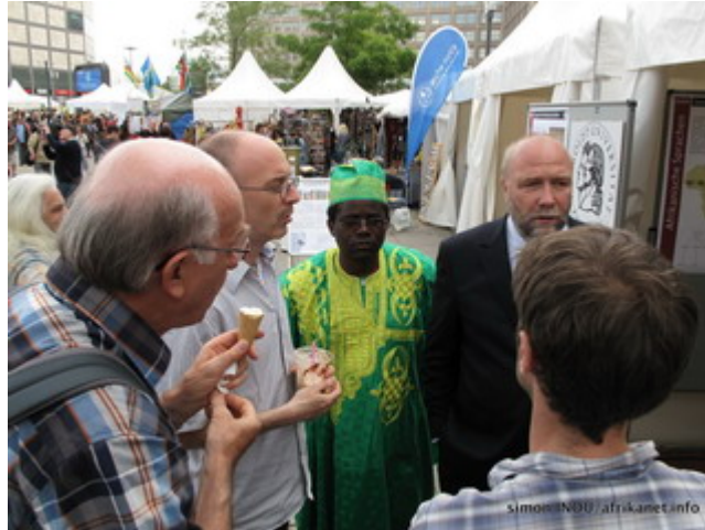
Vor dem Stand des Seminars für Afrikawissenschaften