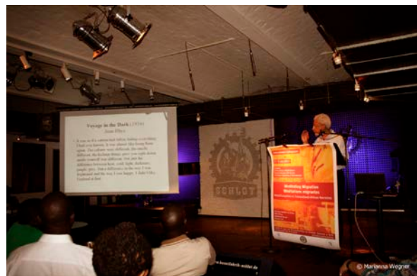
Prof Abdulrazak Gurnah delivers his opening keynote „Reflections on Disembarkation“ at the Jazzkeller Schlot